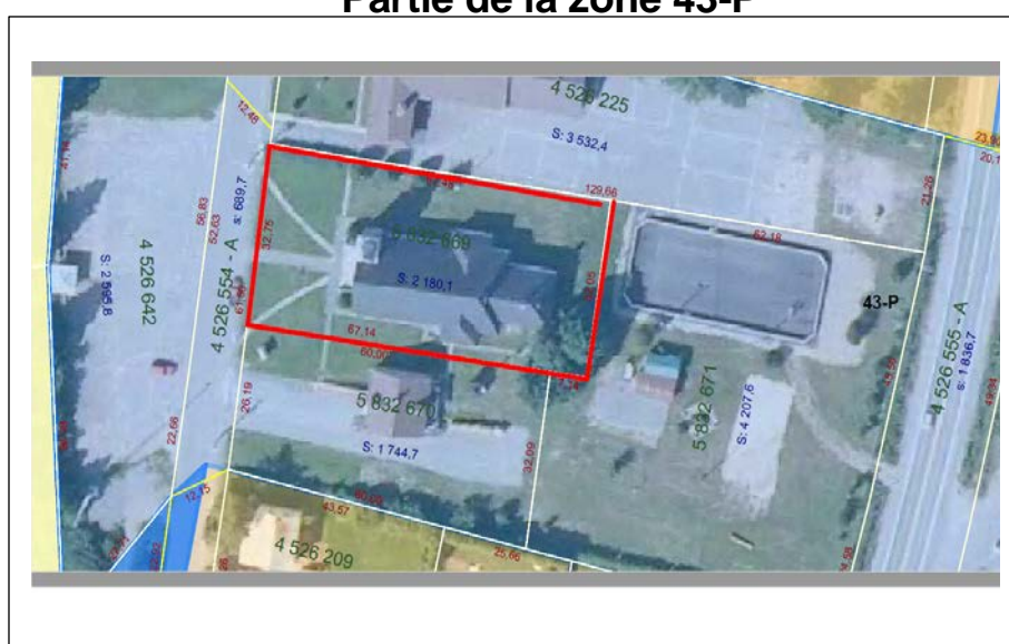
Figure 1 Partie de la zone 43-P

L'étendu de la zone 43-P est modifié par le retrait du lot 5 832 669 figure 1)