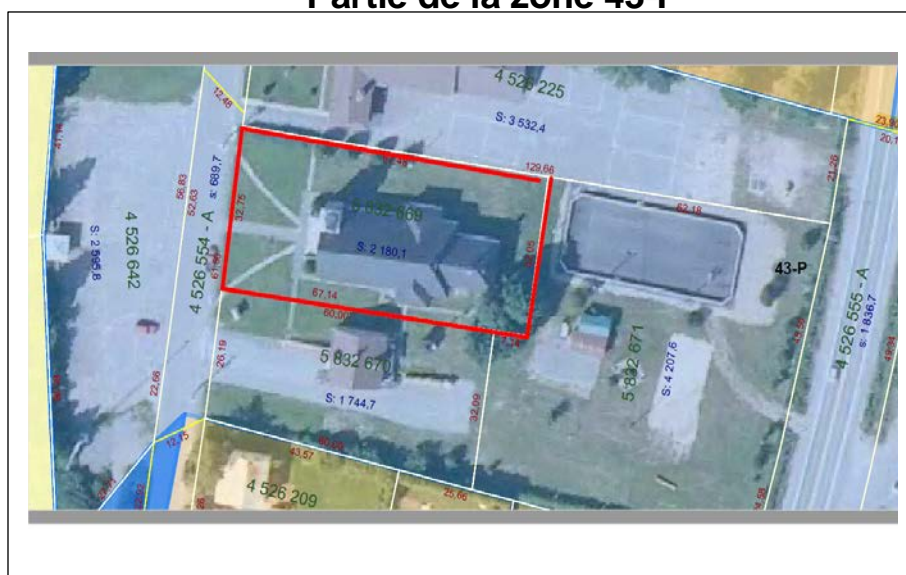
Figure 1 Partie de la zone 43-P

L'étendu de la zone 43-P est modifiée par le retrait du lot 5 832 669 figure 1)